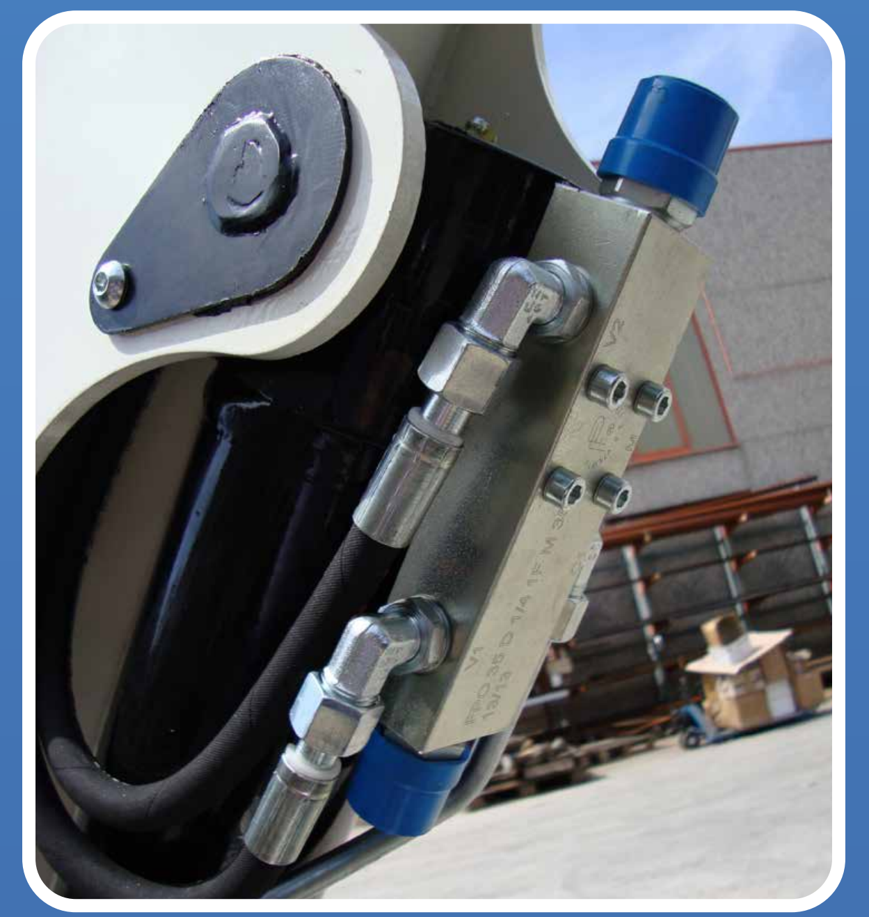
VALVOLE DEI CILINDRI FLANGIATE