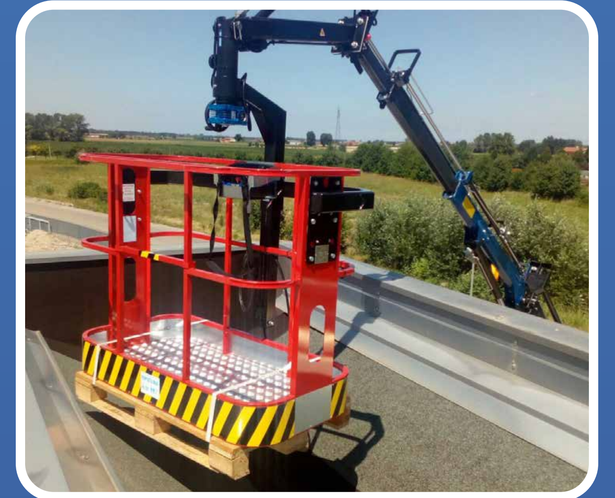
CESTELLO OMOLOGATO PLE